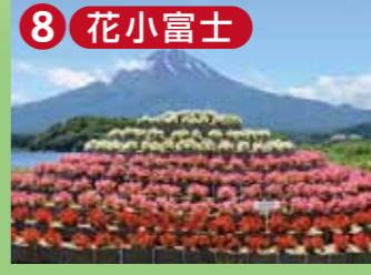
8 花小富士 色鮮やかな花と富士山の絶景をお楽しみください。