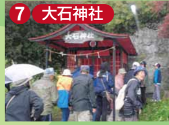
7 大石神社 大石地区の名前の由来であるといわれる、高さ2丈7尺余(8mちょっと)、周囲7丈6尺余(23mちょっと)という大きな石が祀られています。