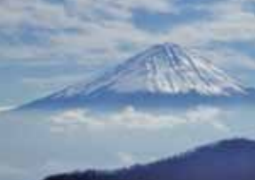
◎大石峠からの富士