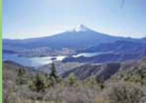
◎B新道峠からの富士