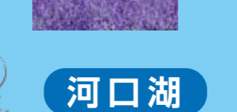
長崎公園 裾野の広がる富士山と桜と一緒に撮影できる、隠れスポット。日当たりも抜群。自転車ツーリングの休憩にもおすすめです。