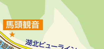
馬頭観音 裾野の広がる富士山と桜と一緒に撮影できる、隠れスポット。日当たりも抜群。自転車ツーリングの休憩にもおすすめです。