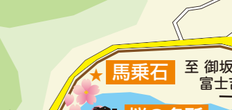
桜の名所 春は桜の並木が見事で、夏もさまざまな花が楽しめます。