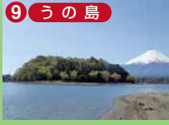
9 うの島 富士五湖の唯一の島。島には豊玉姫命(通称「島の弁天」)が祀られ、4月25日が例祭日である。