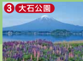
3 大石公園 富士山の景勝地、四季折々の花を楽しむ魅力いっぱいの大石公園では全長350メートルの花道が楽しめます。