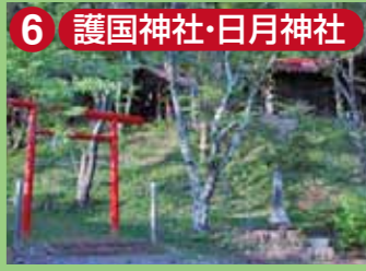
6 護国神社・日月神社 大石地区は昔、上と下に分かれていた。当時、上の村の小正月もここで行なわれていた。現在は児童公園にもなっている。愛称はおてんとさま。