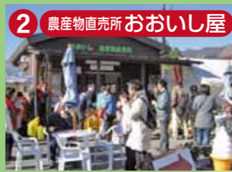
2 農産物直売所 おおいし屋 地元で生産された新鮮な農産物・特産物を販売します。もちろん地元の大石観光協会が運営しているので観光や宿泊などのご案内もOKです。