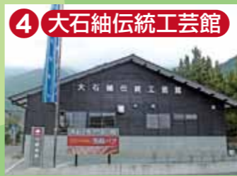
4 大石紬伝統工芸館 館内には大石紬の着物が展示され、機織り機が並んでいます。機織の実演も見学出来ます(要予約)。大石紬の着尺や小物などを販売するコーナーもあります。