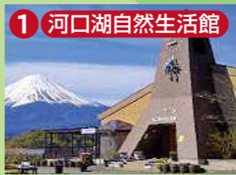
1 河口湖自然生活館 ブルーベリーをテーマに食品や香り関連の商品を数多く取り揃えています。ジャム作り体験教室、コーヒー、紅茶、ブルーベリーソフトクリームもどうぞ!