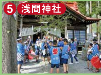
5 浅間神社 こもりした森の中の神社。毎年1月14日の小正月には大石の最大のお祭り「十四日祭礼」が行われる。別名:御手洗神社。